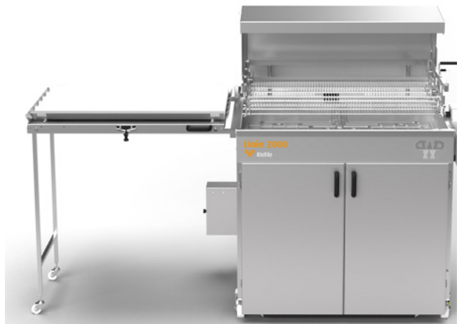
OPTIONAL: EINGEBAUTER GÄRRaum IM UNTERGESTELL